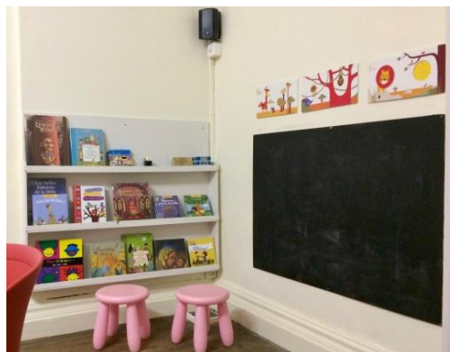
La salle des enfants