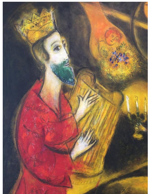
Marc Chagall, Le roi David, 1951